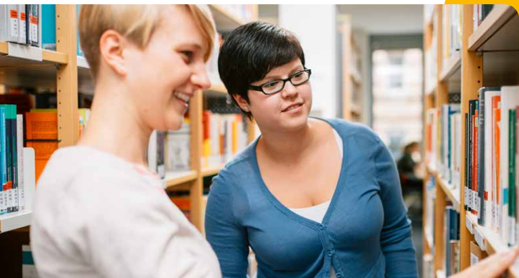
Pflege Dual Bachelor of Science (B.Sc.)

Das Studium verbindet eine berufsqualifizierende Ausbildung mit dem Bachelorabschluss in der Pflege. Die Studierenden lernen auf der Grundlage wissenschaftlicher Erkenntnisse, pflegerische Handlungen zu planen, durchzuführen und zu evaluieren. Außerdem sollen sie ethische Konflikte im Berufsfeld identifizieren und ihre Entscheidungen auf Basis ethischer Modelle reflektieren und begründen können. Ein weiterer Schwerpunkt im Studium ist die Auseinandersetzung mit neuen Versorgungsformen und der Strukturverbesserung im Gesundheitswesen.